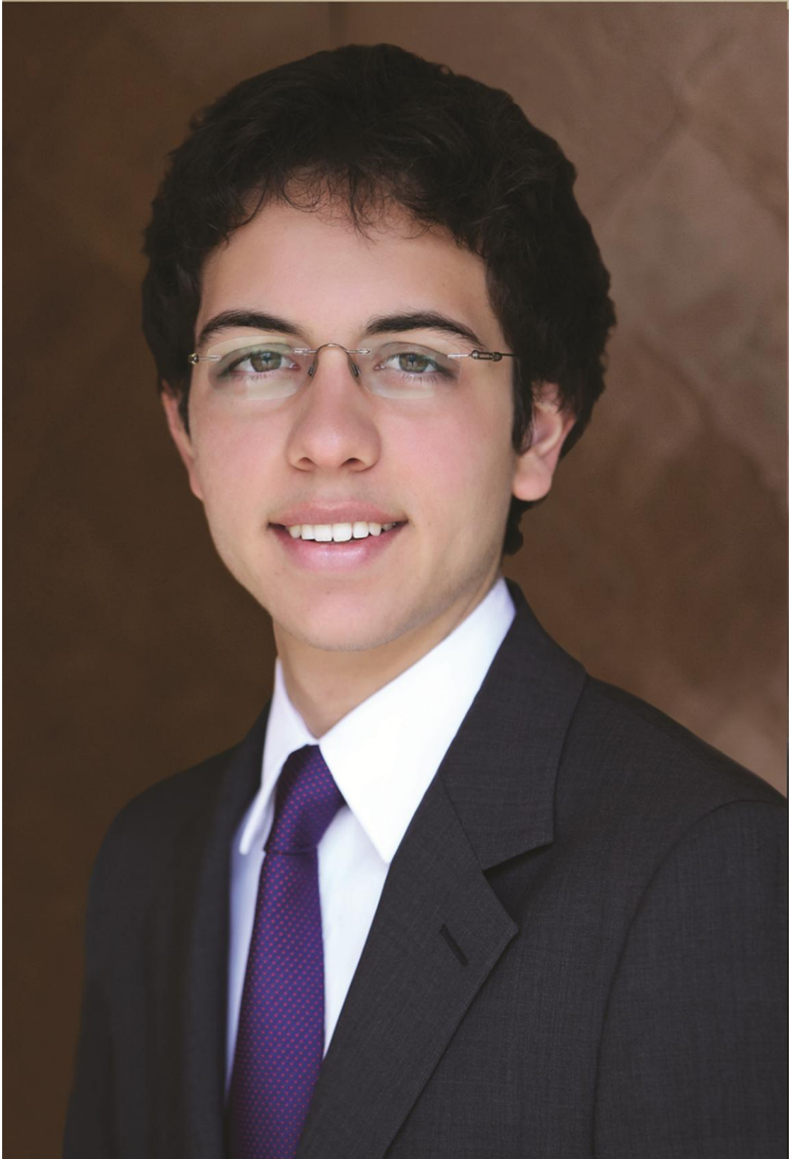
صاحب السمو الملكي الأمير حسين بن عبد الله الثاني ولي العهد المعظم