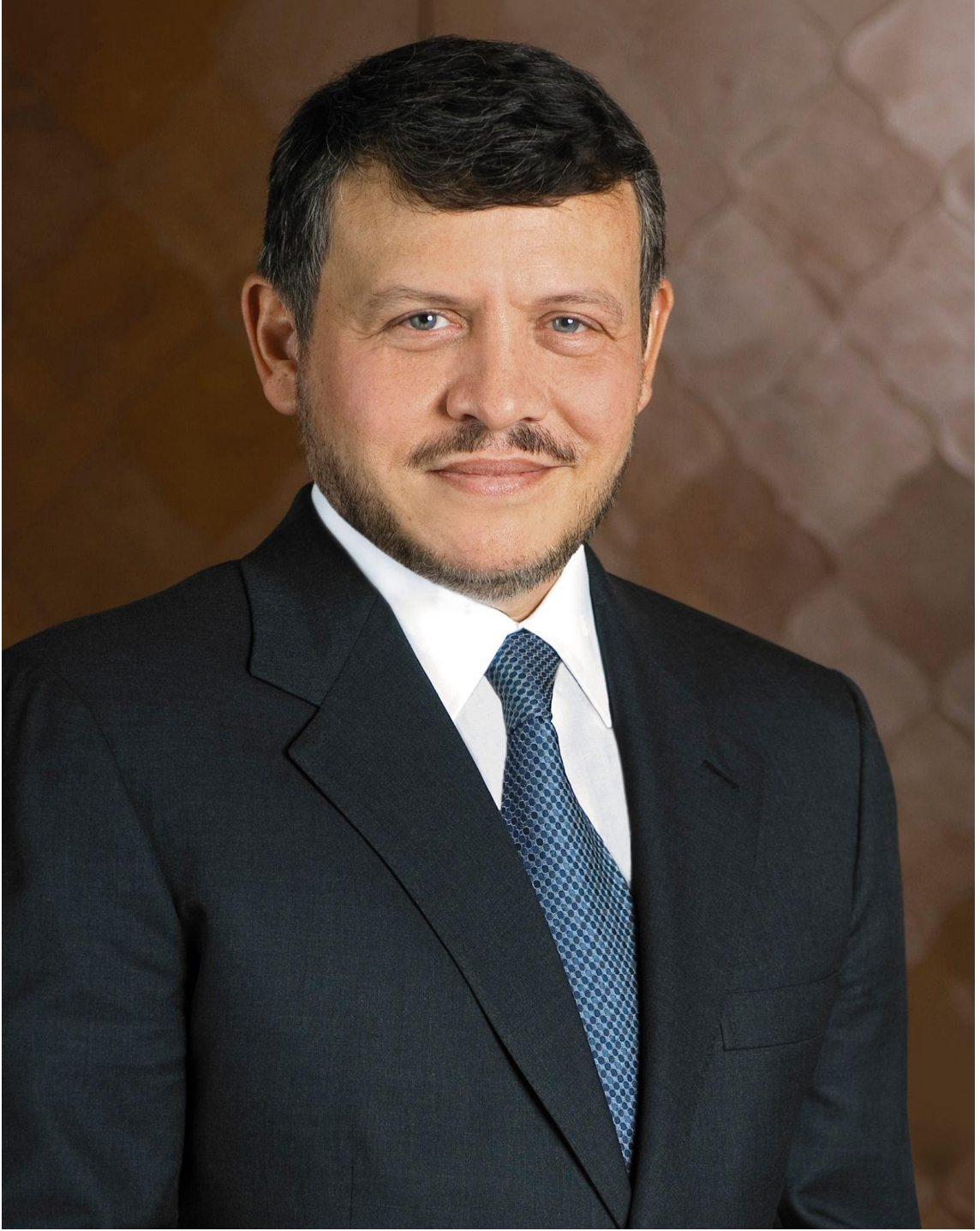
حضرة صاحب الجلالة الملك عبد الله الثاني ابن الحسين المعظم