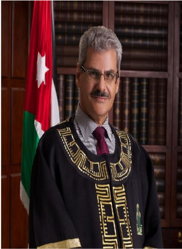
عطوفة الأستاذ الدكتور ضياء الدين عرفة رئيس جامعة آل البيت