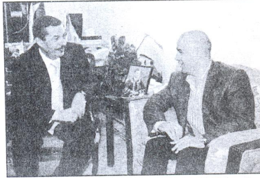
● جانب من الزيارة

الديار - أكد وزير الاتصالات وتكنولوجيا المعلومات مروان جمعة أهمية إشراك القطاع الخاص والعام في التعاون المشترك واستمرارية إقامة العلاقات المتبادلة وبما تعود بالفائدة على مصلحة الوطن والمواطن وخلق فرص للخريجين في الاستفادة من هذه المؤسسات.