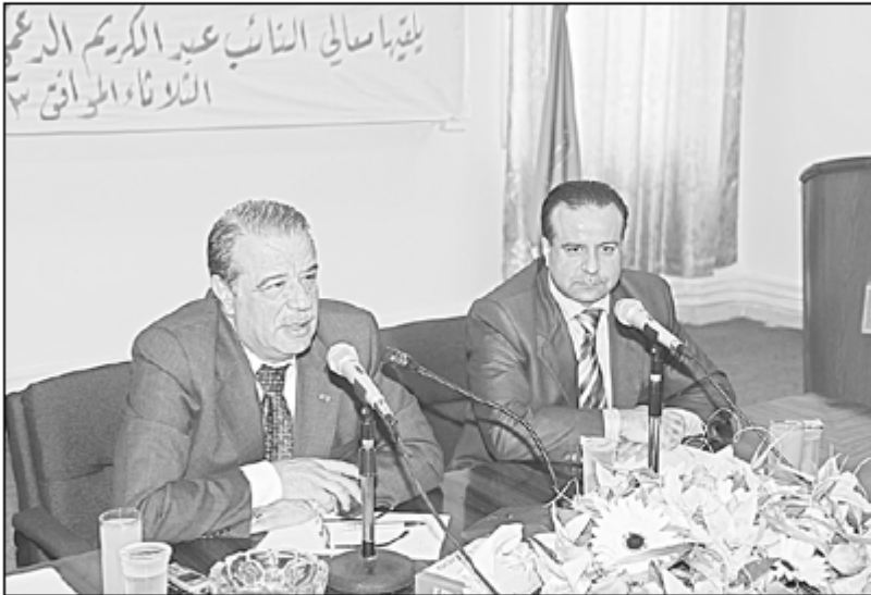
● من المحاضرة

والتي ستساهم بالضرورة إلى تعزيز سيادة القانون والحفاظ على حقوق الوطن والمواطن معاً واستعراض النائب الدغمي مهام السلطات الثلاث التشريعية والتنفيذية والقضائية ومبدأ الفصل بينهما بحسب الدستور الأردني بحيث تتولى السلطة التنفيذية إدارة شؤون الدولة والمال العام وتنفيذ القرارات المتعلقة بالدخل والخارج بالإضافة إلى تنفيذ علاقات الأردن مع دول العالم موضحاً أن السلطة التشريعية والمتمثلة بمجلس الأمة بشقيه النواب والأعيان تقوم بوضع القوانين ومراقبة ومحاسبة أداء الحكومة بمجموعة من الإجراءات المتبعة بهذا الخصوص.