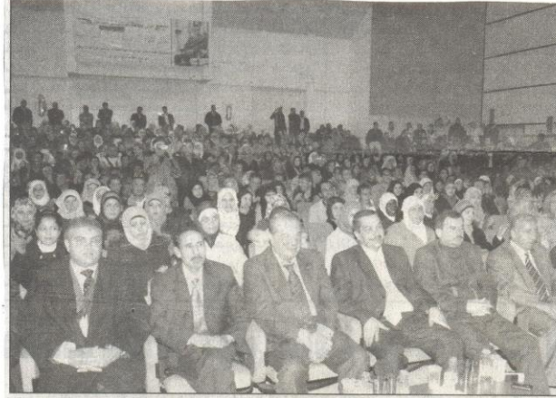
● آل البيت تحتفل بطلبتها الجدد

العدد : ١٧١٩ صفحة : ٥ اليوم : الخميس التاريخ : ٥ / ١١ / ٢٠٠٩