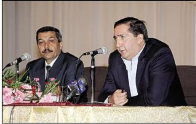
رئيس الوزراء يشار في جامعة آل البيت

وفي ختام اللقاء الذي حضره نواب رئيس الجامعة والعمداء اجاب الرفاعي على اسئلة الطلبة واستفساراتهم.