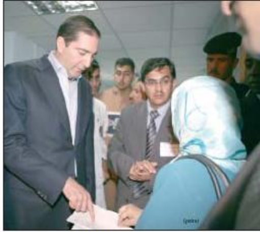
رئيس الوزراء خلال جولته في البادية الشمالية

المشروعات التنموية والخدمات التي تنعكس على حياة المواطن وتحسن من ظروفه المعيشية خاصة في قطاعي الصحة والتعليم والخدمات الأخرى. << التفاصيل ص ٤