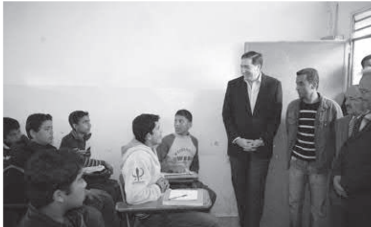
رئيس الوزراء سمير الرفاعي يستمع الى طلبة في احد الصفوف في مدرسة بالمفرد امس

المفرد - أكد رئيس الوزراء سمير الرفاعي أن جلالة الملك عبدالله الثاني أوعز إلى الحكومة بضرورة التركيز على محورين يدعم المواطن وتحفيز النمو الاقتصادي وحماية الفئات الفقيرة. وأشار الرفاعي خلال لقائه طلبة جامعة آل البيت وأعضاء الهيئة التدريسية في مرجع الحسين بن علي امس، إلى أن الحكومة ستعمل على تنفيذ خطة المحاور، من خلال توفير القيادة المستنيرة والاستقرار والمواطن المعلم المثقف ووجود الطبقة الوسطى. وقال إن الحكومة باتخاذها جملة من القرارات، تمكنت من توفير 160 مليون دينار للخزينة، خلافاً عن أن الحكومة درست 2500 برنامج حسب أولوياتها، فيما ستقدم هذه الدراسة خدمة واضحة ومباشرة للخزينة والاقتصاد الأردني الذي سيتعاضد ويعود لأرقامه الجيدة.