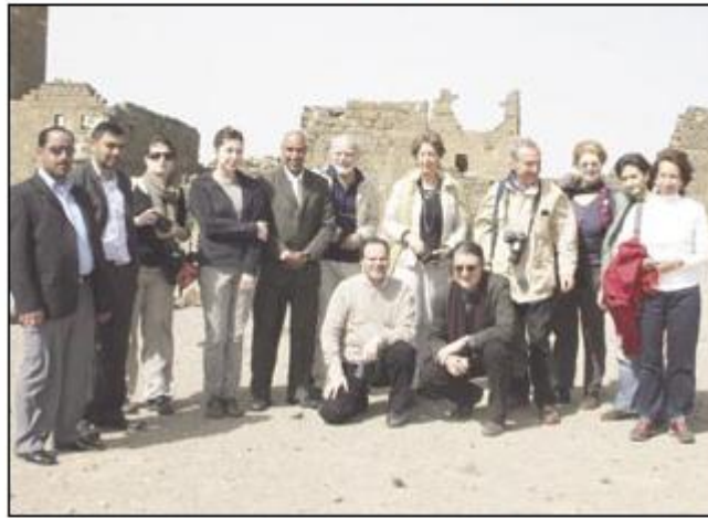
المشاركون في ورشة تطوير أم الجمال.