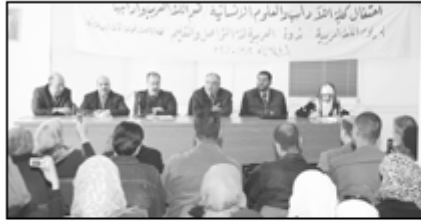
● المشاركون بالندوة

اللغة العربية لغة التواصل والتعليم: ندوة في «آل البيت» بها: تعزيزاً لأهمية معرفة اللغة العربية وأسرارها. وفي نهاية الندوة التي أدارها الدكتور عبد الباسط مرأشدة من قسم اللغة العربية ألقى عدد من الطلبة قصائد شعرية متنوعة، ودار حوار واسع بين المشاركين حول اللغة العربية وأهميتها.