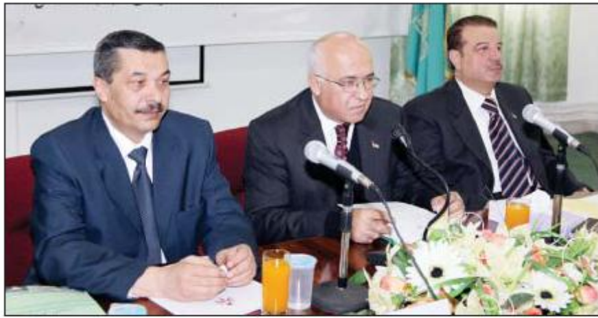
وزير التنمية السياسية خلال الحلق البرنامج بحضور النقيب وشوافة