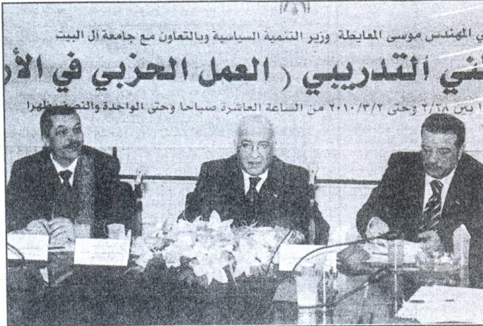
وزير التنمية السياسية يطلق الدورة من جامعة آل البيت

واعتبر ان الحل الامثل لهذة الحالة هو توفير ارضية تتلاءم ومتطلبات التنمية السياسية تكمن بقيام احزاب تنبثق من القواعد الشعبية . وناقش البرنامج التدريبي على مدار ثلاثة ايام اوراق عمل يقدمها متخصصون وتتعلق بالبرلمان والاحزاب والمسيرة الحزبية في الاردن والاحزاب والاعلام ودور الاحزاب في الحياة السياسية .