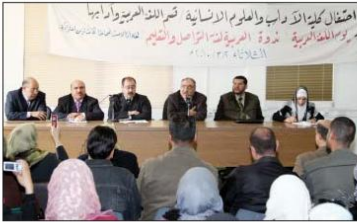
وزير الصحة خلال الندوة