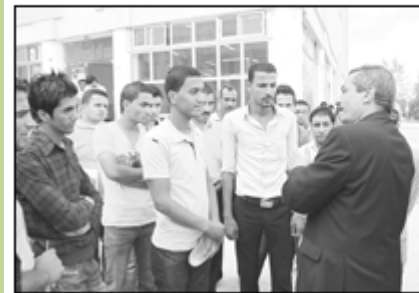
• رئيس الجامعة خلال الجولة

• شدد رئيس جامعة آل البيت الدكتور نبيل شوافه على أهمية تقديم أفضل الخدمات للطلبة وتمس احتياجاتهم وتبنيها ضمن الإمكانيات المتاحة.