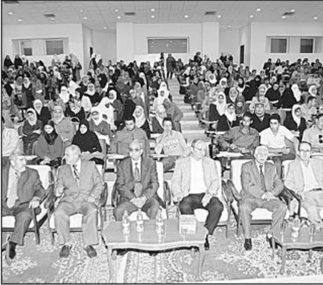
● من الحضور