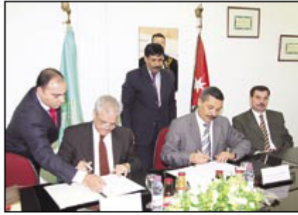
التوقيع والتوقيع يومان الاتفاقية