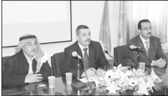
● من اساق المشروع

مبيناً دعم عمادة شؤون الطلبة لمل هذه المشاريع وتوفير الدعم اللازم لها. وقدم الطلبة المشاركون في المشروع عرضاً مفصلاً عن المشروع وأهدافه ورسالته وما هو مطلوب من الأعضاء القيام به للوصول إلى الأهداف المرجوة من إطلاق مثل هذه المشاريع. وتعميم ثقافة القراءة بين الجامعات والمدارس والمستشفيات ووسائل النقل.