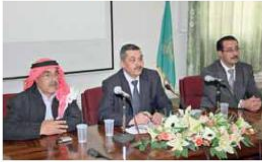
من مؤتمراطلاق المشروع

كما نظمت عمادة شؤون الطلبة بمناسبة عيد ميلاد جلالة الملك المعظم معرضاً للكتاب بالتعاون مع مديرية ثقافة المفرق في قاعة المعارض بعين الإمام مسلم. واشتمل المعرض على ١٢ ألف نسخة تصل ٧٦ عنواناً في مختلف مجالات الحياة الثقافية من أدب وعلوم، منها ١٦ عنواناً تترجم للمرة الأولى.