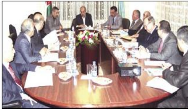
الطراونة يترأس اجتماعا لمجلس امناء جامعة آل البيت

العالم الإسلامي لإجراء دراسات وبحوث متخصصة عن العالم الإسلامي في مختلف المجالات وتطوير معهد الفقه وعلوم الفضاء ليصبح مركز أبحاث إقليمي. وفي مجال خدمة المجتمع المحلي أوضح الدكتور شواقفة بأنه تم التركيز على محور تنمية المجتمع المحلي وتقديم الدعم للتطوير الحضري والاجتماعي والثقافي للمجتمع المحلي في محافظة الفرق من خلال المساهمة في إدخال مفهوم إنتاجية المجتمع والتركيز على الشرائح غير المنتجة وتأهيلها لتصبح قادرة على التنافس في سوق العمل وعقد الدراسات التدريبية في المهارات الحاسوبية والقوية والإدارية لأبناء المجتمع المحلي وتقديم الدعم التقني والفني والمادي للإسهامات المجتمعية المدل في محافظة الفرق والمساهمة في تحقيق التنمية الاقتصادية للمجتمع في محافظة الفرق. وأعد الدكتور شواقفة بأنه تم إجراء مسوحات اقتصادية واجتماعية للمحافظة بهدف تفعيل صندوق الاستثمار للعمل على بعض المشاريع الاستثمارية في مناطق الجامعة القريبة من مدينة الفرق إضافة إلى ذلك اشتملت الخطة الاستراتيجية على التطوير الإداري والفني في الجامعة وتطوير البنية التحتية للبحر الجامعي ومحور البنية الجامعية للطلاب من خلال صقل شخصية الطالب وترسيخ المواطنة الصالحة والممارسات الديمقراطية والسلوكيات الإيجابية وتنمية علاقته إيجابيا مع أعضاء الهيئات التدريسية والإدارية، مما ركزت الخطة على زيادة عدد الطلبة وتوفير بيئة جامعية مناسبة واستقطاب طلبة وافدين من مختلف دول العالم.