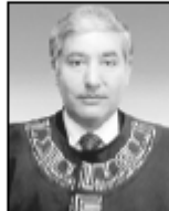
• د. شديقات

الادماج، فهي ملتكمه دولية ذات سمعة عالية جداً تسعى لتطوير أعضائها في المجالات التي تتبادل والشخصي، من خلال تبادل الخبرات بفعالية عالية، حيث أنها تقدم خدمات بكفاءة وأخلاقية عالية، كما أنها تتسامح في حل كثير من المشكلات وتبني، على كثير من الاستفسارات فن يوجد حسب رغباتهم واقتنائهم فهي تقدم الخبرة والمشورة في أي وقت يطلب منها ذلك، وكما أن هذه المؤسسة الدولية تؤمن أن أعضائها هم الأفضل وتكافح دوماً من أجل أن تقدم الأفضل ومسورة مستمرة.