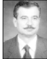
• د. جهاد المجازي

• فرز ميلاد أبناء جامعة آل البيت تجديد تعيين الاستاذ الدكتور جهاد شامس المجازي نائبا لرئيس جامعة آل البيت لمدة ثلاث سنوات. ياكوربان الدكتور المجازي حاصل على درجة الدكتوراه في النقد الأدبي من جامعة مانشستر في بريطانيا عام 1988 ودرجة الماجستير في النقد الأدبي من الجامعة الأردنية عام 1989م ويكادوربوس لغة عربية من الجامعة الأردنية عام 1990م.