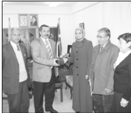
من حفل التكريم