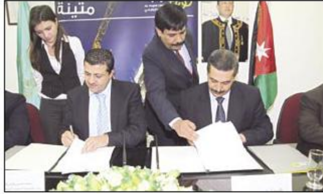
د. شوافة وراعيان يوقعان الاتفاقية