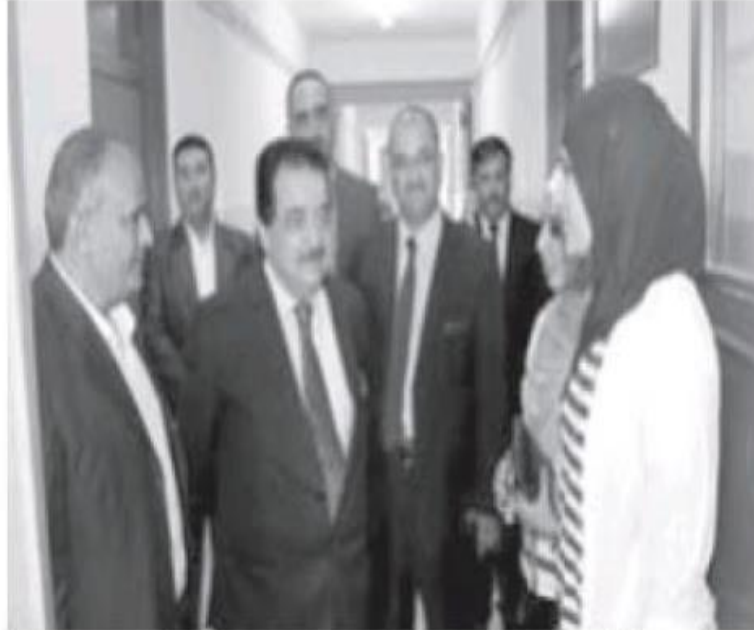
رئيس جامعة آل البيت الدكتور عدنان العتوم يتفقد إجراءات استقبال الطلبة الجدد