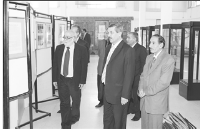
رئيس جامعة فنزويلا خلال جولته في مرافق الجامعة