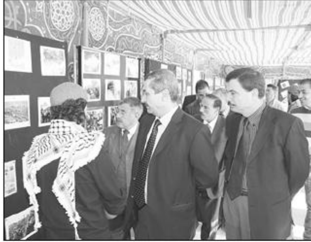
• شوافقة يفتتح معرض الصور في الذكرى الأولى للعدوان على غزة