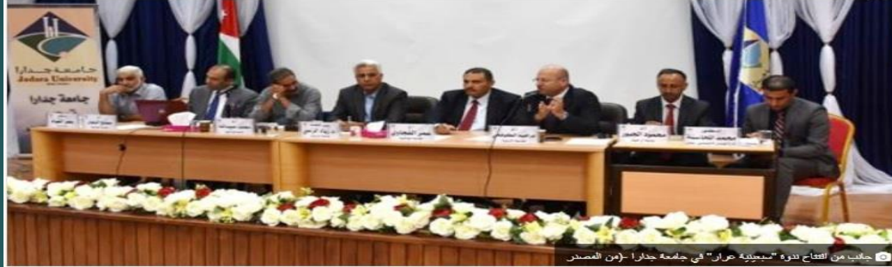
جانب من افتتاح ندوة “سبعينية عرار” في جامعة جدارا