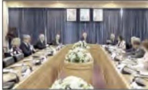
من الاجتماع الذي عقد بحضور وزراء ورئيس تربوية النواب

وقأت الأسباب الموجبة لـ "معدّل الجامعات الأردنية"، بهدف السماح للجامعات بإنشاء مراكز للتعليم والتدريب والاستشارات والخدمات خارج موقع الجامعة، وإنشاء مدارس وأي برامج خاصة في موقع الجامعة فقط، وعدم فتح مراكز ومكاتب ارتباط للجامعات خارج حرمها.