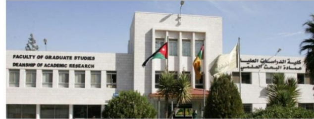
الاردن - غزة بوست

تصدر الجامعات الأردنية بالتعاون مع وزارة التربية والتعليم العالي ووحدة التنسيق والقبول الموحد معدلات القبول في الجامعات الأردنية للعام 2020 - 2019 بشكل حصري لجميع طلاب وطالبات الناجحين في امتحانات التوجيهي الدورة الصيفية ، لكي يتسنى لجميع الطلاب التعرف على معدلات القبول الخاص بكل كلية .