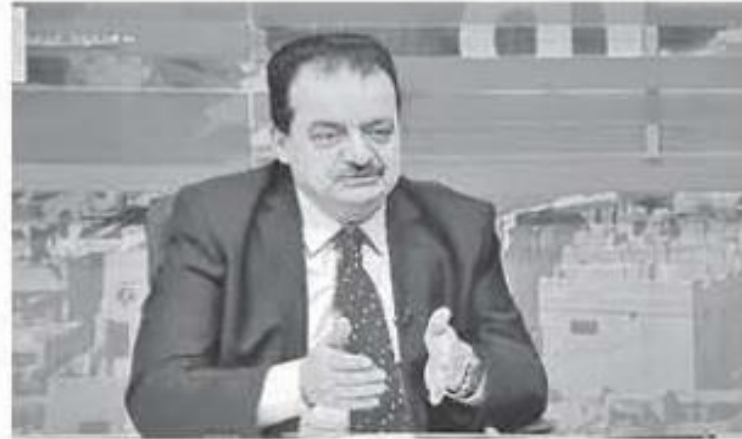
مجلس مركز اللغات وذلك للاطلاع على سير عمل المركز - وقدم مدير المركز