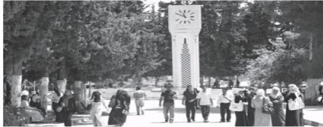
طلبة داخل حرم الجامعة الأردنية - (أرشيفية)

وتشدد أبو غزالة على أهمية إعادة النظر ببنية السلم التعليمي للنظام التربوي، واعتماد نظام الشجيرة التعليمية إذا ما أرادت أن تفل مشكل الاختيار غير المناسب أو التخصصات الزائدة وبالتالي البطالة، مشيراً إلى أنه يمكن أيضاً تحديد سن معينة للتوجيه حسب الميول والقرارات والمهارات، ولكن سن الثانية عشرة، لأنه يتيح فرصاً تعليمية متنوعة ومرنة ومستمرة أمام الطلبة، ويحقق