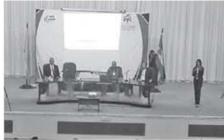
الاتباط - المفرق - يوسف المسابقة

تم تحدثت حول الجائزة وأهميتها والقطاعات الست التي تستهدفها الجائزة وهي التعليم والصحة والسياحة وبيئة الأعمال والنقل والمياه مبنية معايير التقييم التي ستخضع لها التطبيقات التي ستقدم للجائزة والاطار الزمني للجائزة وشروط المشاركة وكيفية المشاركة، وعرضت قائمة بمعلومات الاتصال لضباط ارتباط الجائزة في المؤسسات الحكومية المختلفة