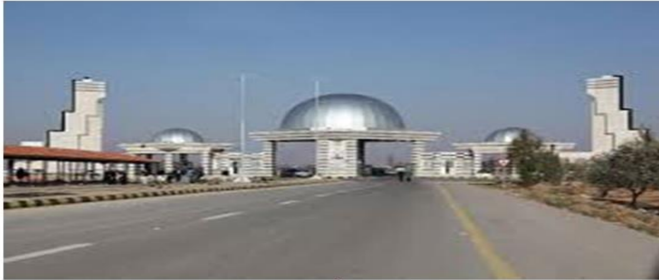
جامعة آل البيت

تم نشره الأربعاء 26 حزيران / يونيو 2019 10:25 مساءً