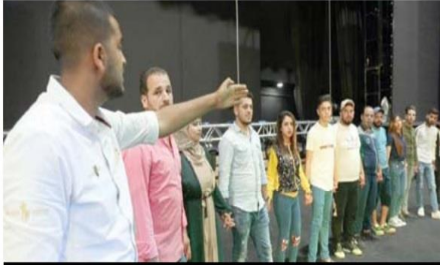
جانب من التحضيرات للاحتفال بالمناسبة