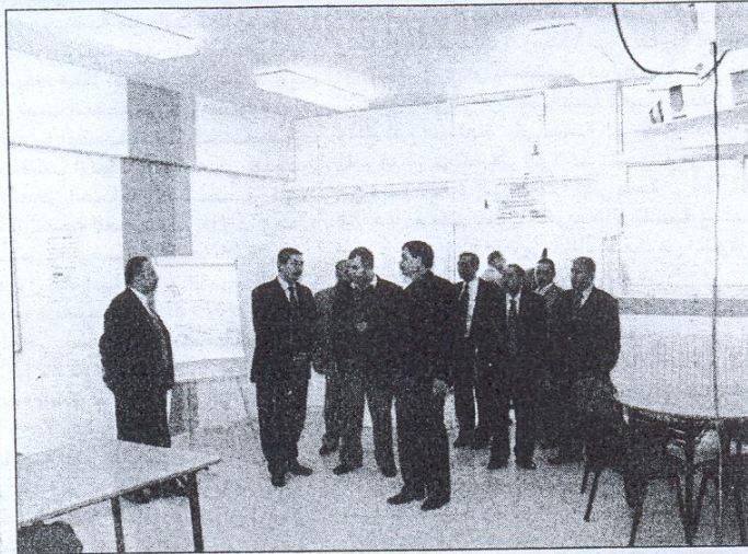
● افتتاح قاعات في آل البيت