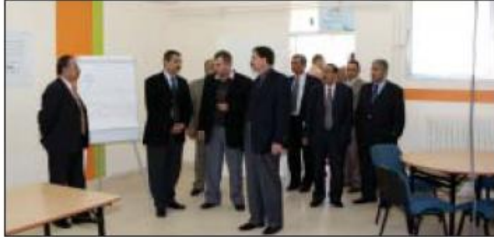
د. شواقفة خلال افتتاحه إحدى القاعات.

ضمن سعي جامعة آل البيت للتحديث والتجديد افتتح رئيس الجامعة الدكتور نبيل شواقفة العديد من القاعات التدريسية النموذجية بالجامعة لتحسين أقم الخدمات التعليمية المقدمة للطلبة وسهول الإجراء «الريشة» مع توفير المستلزمات الإيضاحية فيها ذات العلاقة بالعملية التعليمية التي يحتاجها الطلبة. وأعد الدكتور شواقفة خلال الافتتاح ولقائه مجموعة من طلبة الجامعة أهمية العمل على توفير متطلبات الرعاية الجامعية والبيئة التعليمية التي تتناسب ومتطلبات