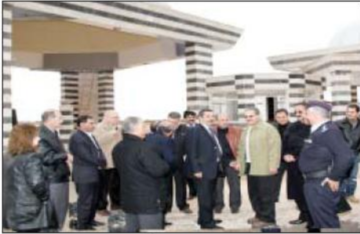
وزير الأشغال خلال زيارته جامعة آل البيت