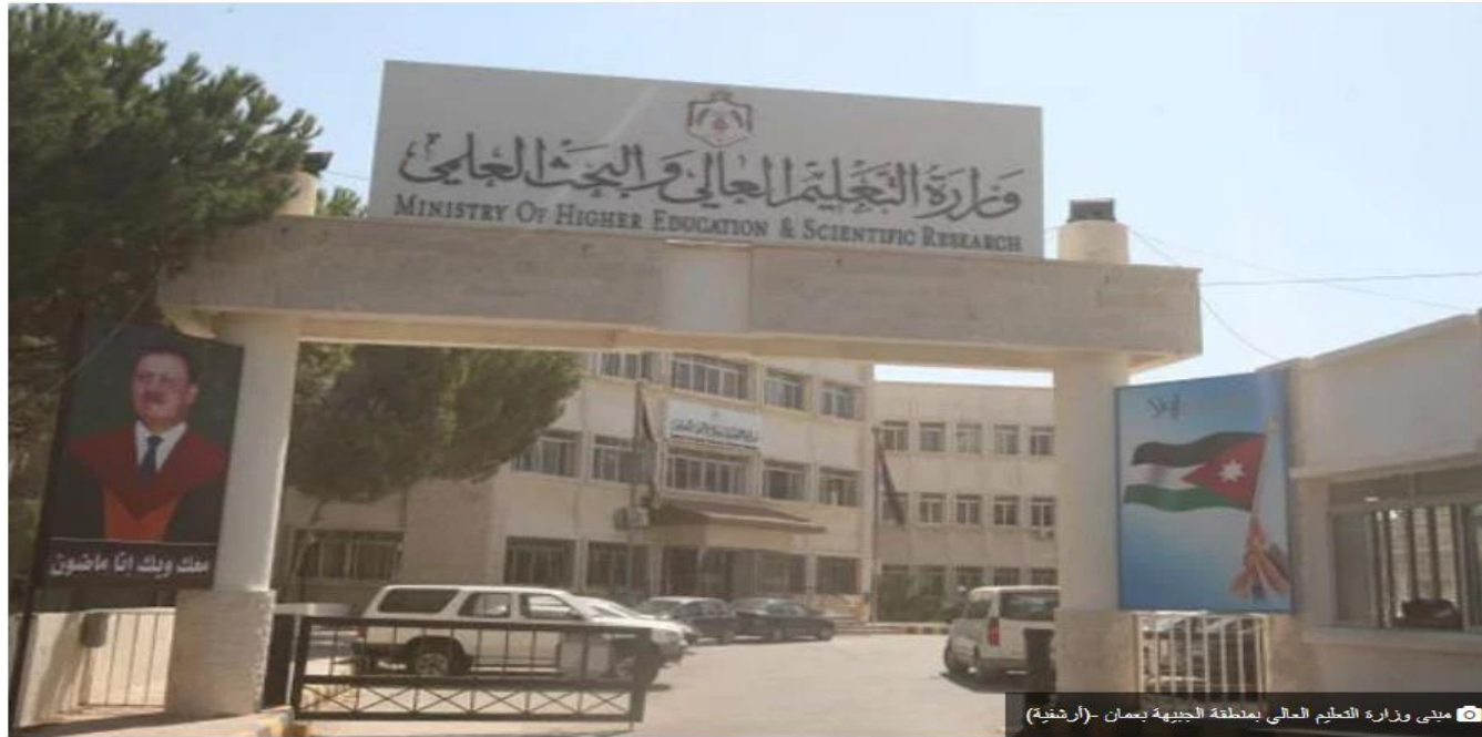
مبنى وزارة التعليم العالي بمنطقة الجيبة بعمان - (أرشيفية)