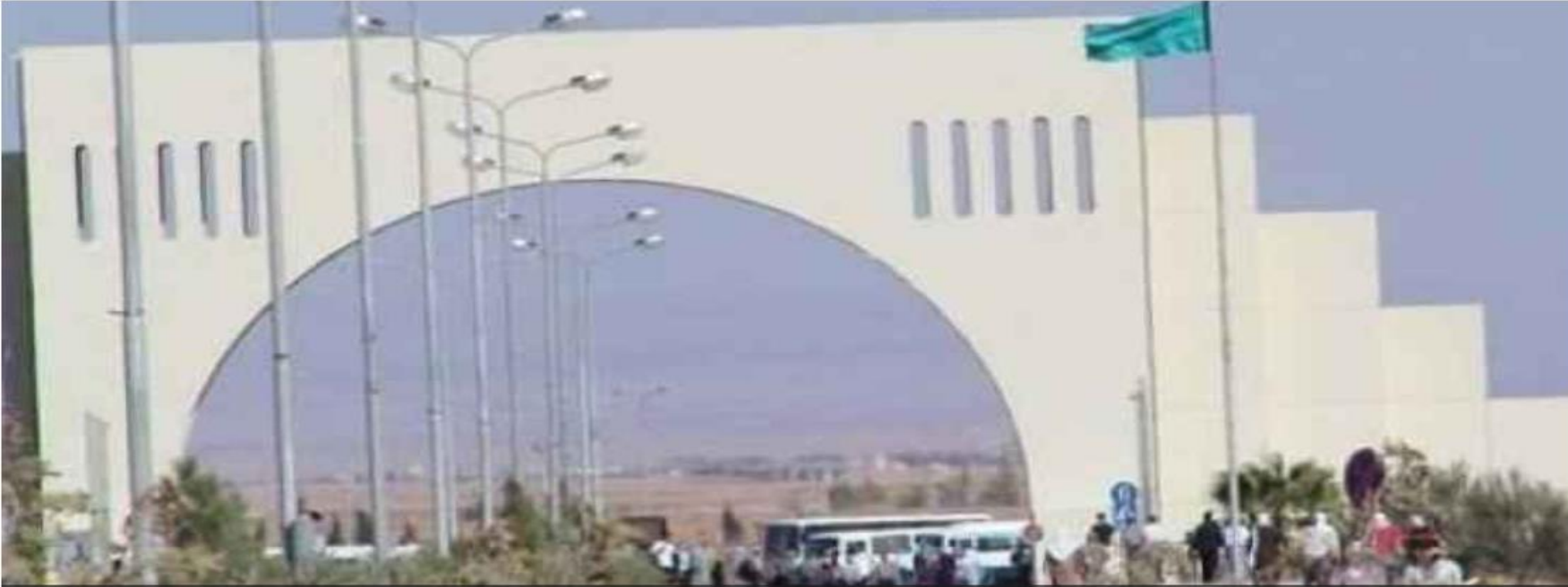
جامعة آل البيت - ارشيفية

قرر رئيس جامعة آل البيت الدكتور عدنان العتوم تأخير جلسات امتحانات يوم الأربعاء 45 دقيقة، بالنظر للظروف الجوية المتوقعة.