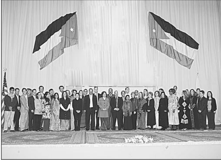
صورة جماعية لخريجي الفوج مع لطوف