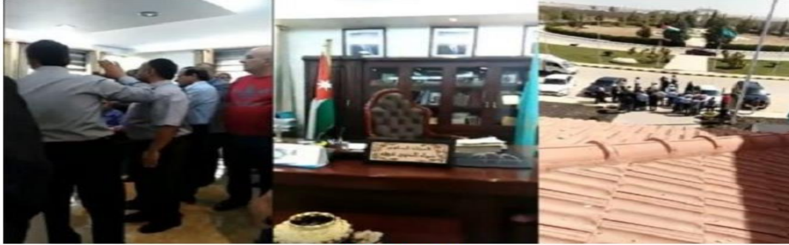
افتتاح مكتب عرفة

المدينة نيوز :- افرجت الاجهزة الأمنية . الثلاثاء . عن 10 موظفين تم توقيهم على خلفية احداث جامعة آل البيت الأخيرة .