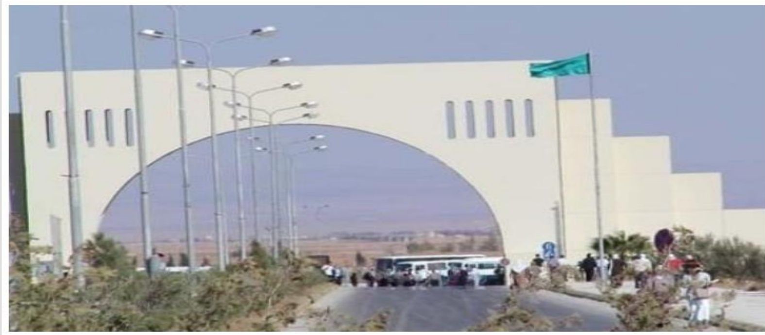
جامعة آل البيت

خبرني - قرر مدعي عام المفرق، الثلاثاء، تكفيل 10 أشخاص من جامعة آل البيت، جرى توقيفهم قبل يومين، على خلفية اقتحام مكتب رئيس الجامعة.