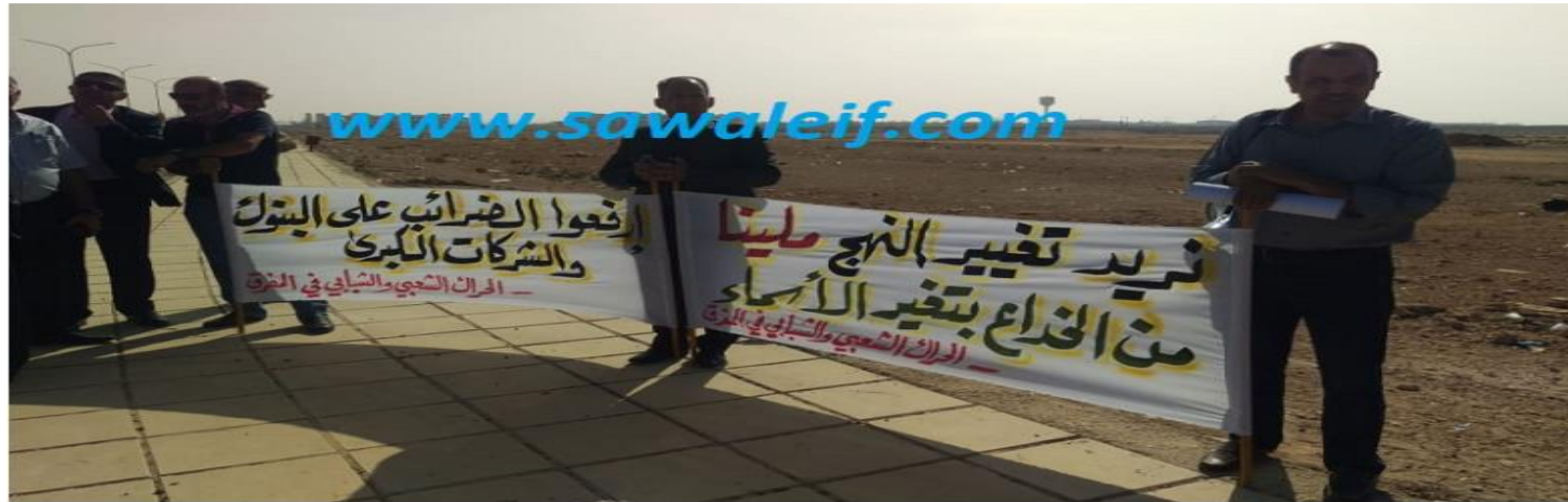
نشطاء يعتصمون أمام " آل البيت" بانتظار الوفد الوزاري / صور +

الرئيسية « أخبار محلية « نشطاء يعتصمون أمام " آل البيت" بانتظار الوفد الوزاري / صور + فيديو