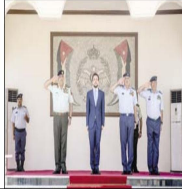
سمو ولي العهد يقبل الأجنحة للخريجين ويوزع الجوائز التقديرية على الأوائل الفائزين