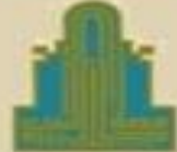
جامعة ال البيت Al al-Bayt University