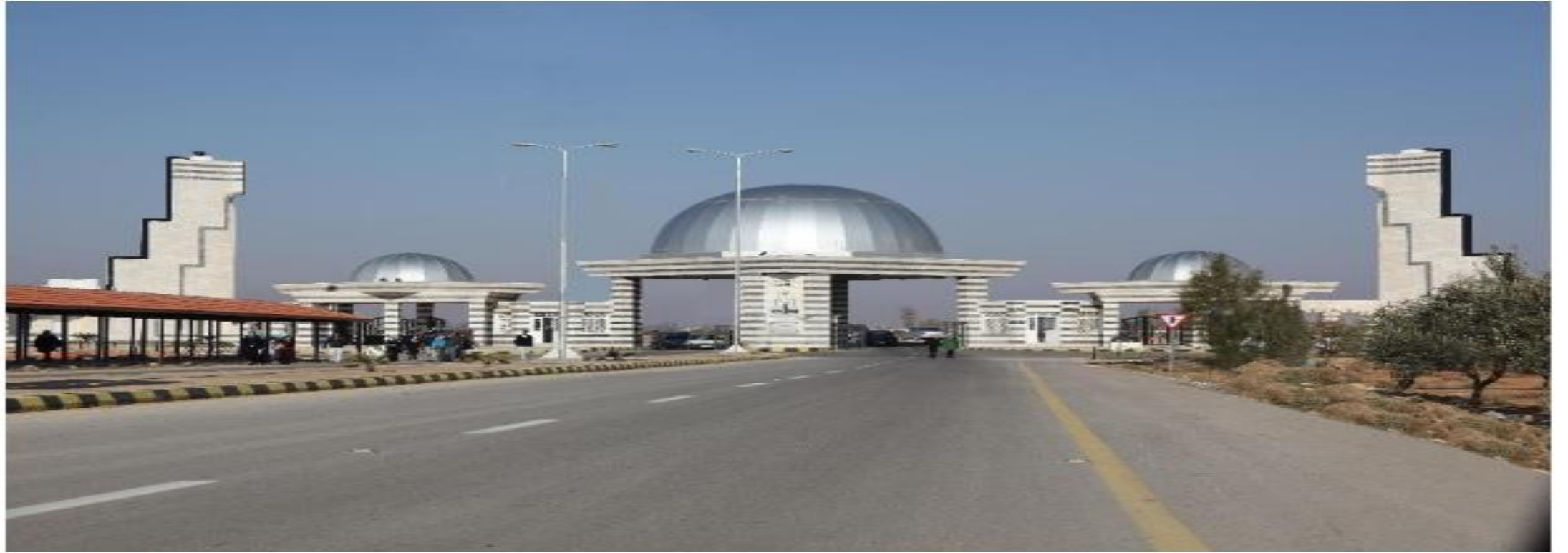
تعيين اعضاء مجلس امناء جامعة آل البيت (اسماء)