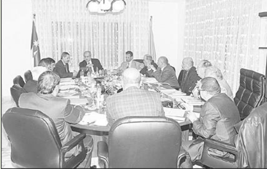
الطراونة يترأس اجتماع مجلس أمناء جامعة آل البيت