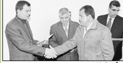
من حفل التخرج