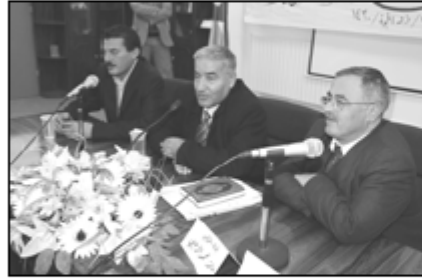
• شديقات خلال افتتاح البرنامج

وقام الدكتور يحيى شديقات برأفقه عميد شؤون الطلبة في الجامعة الدكتور علي عليعات بجولة ميدانية على مواقع المسابقات اطلع خلالها على آلية إجراء الامتحانات للمتسابقين والمشاركين بلغات البرنامج.