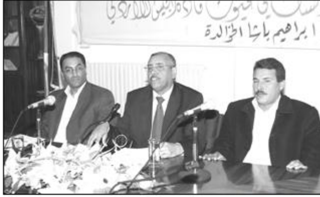
• اللواء الخوالدة خلال المحاضرة

الإنسماق، وكيف تم توزيع مكتسبات التنمية لتشمل الوطن كله عاكساً بالتالي رؤية الراحل العظيم للأردن الأمونج. وفي ختام المحاضرة التي أدارها مساعد عميد شؤون الطلبة الدكتور هيلم القاضي وحضرها طلبة الجامعة أجاب الخوالدة عن أسئلة واستفسارات الطلبة وملاحظاتهم.