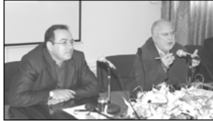
• جات، من المحاضرة

تضم متاحف وحدائق وملاعب و وحدات ترفيهية. ومن أشهر المشاريع للمهندس المعماري حماد ميني الموظفون لأمانة عمان الكبرى ومبنى مركز الحسين الثقافي ومسجد النورين التابعين لموقع رأس العين. كما صمم العديد من الفلل الخاصة. وفي نهاية المحاضرة التي أدارها عميد معهد العمارة الدكتور علي أبو غنيمه أجاب المهندس عن أسئلة الطلبة والحضور واستفساراتهم.