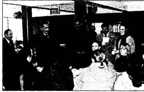
● شواقفة ملتقيا وفد فرق السلام