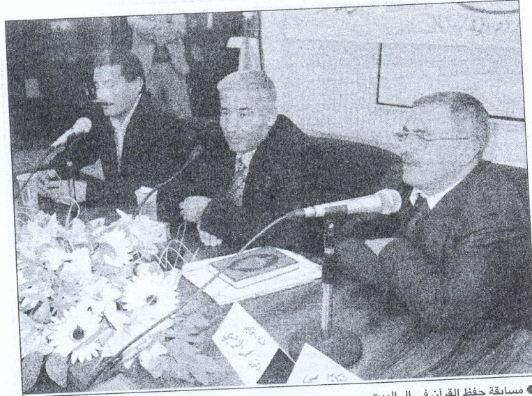
● مسابقة حفظ القرآن في آل البيت