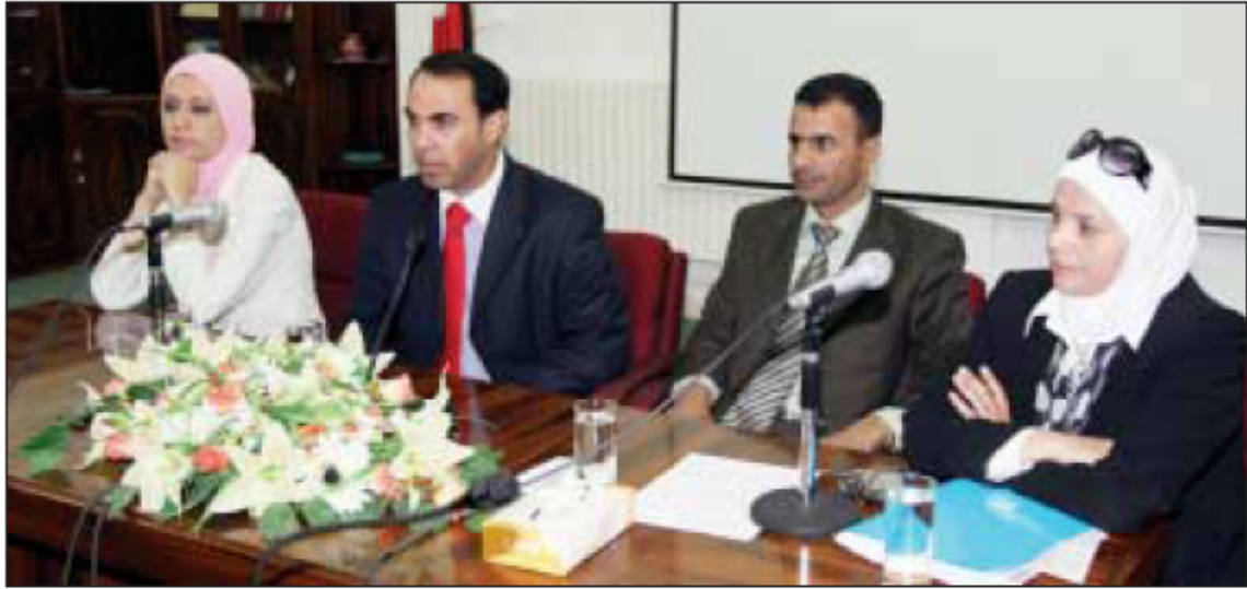
مشاركون في الدورة