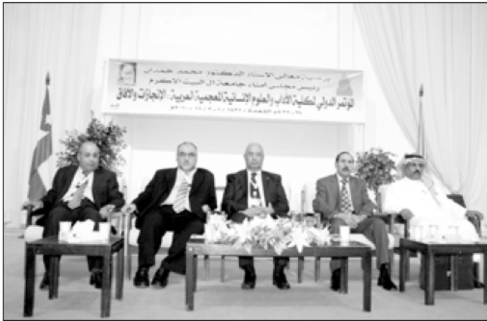
من افتتاح المؤتمر

استعداد المحافظة لتقديم كافة التسهيلات اللازمة لهؤلاء المتطوعين للقيام بالمهام الإنسانية والإطلاع على ثقافات بلدنا. وبين نائب السفير مانديل بان هذه الدفعة هي الرابعة عشرة في الأردن والثانية في جامعة آل البيت للقيام بأعمال تطوعية مشيدا بالأعمال التي قامت بها الجامعة لتأهيل وتعليم الدفعة المتطوعة لفتح أسس حفظ المفروق. وقال رئيس جامعة آل البيت د. نبيل شواقفة أمس خلال حفل استقبال الدفعة بحضور محافظ المفروق علي نزال ونائب السفير الأمريكي في عمان لاري مانديل ان الجامعة وضعت برنامجا متكاملًا للمتطوعين لتعلم اللغة العربية وتعريفهم بالعادات والتقاليد المشتركة وتماراج الثقافات مشيدا بدور فرق السلام الأميركية في تعزيز هذا المنهج وأداء مهامهم الإنسانية والتعليمية والاجتماعية. وأبدى المحافظ علي نزال