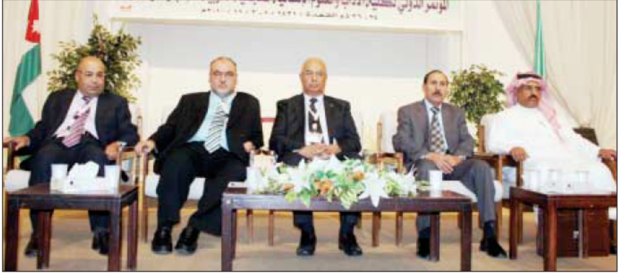
د. حمدان خلال رعايته افتتاح المؤتمر

الإمام محمد بن سعود الإسلامية الدكتور محمد بن نافع العنزي بان علماء الأمة العربية حرصوا إلى صنع معجم يهدف إلى الحفاظ على لغة القرآن الكريم فكان معجم زاهر بمادته وتنوع أبوابه مبيناً عبقرية العرب في بداوتهم وعبقريتهم بعد أن صقلتهم حضارة الإسلام على الرغم من سبق الصينيين في وضع المعجمات اللغوية فإن العرب هم من أسس الأمم إلى وضع المعجمات اللغوية .