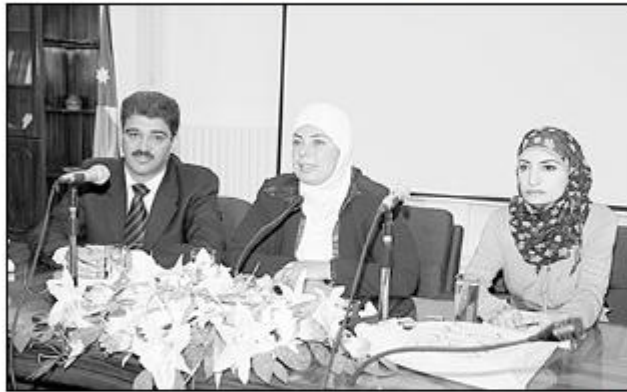
المحامية النظمي والمزاعةلة خلال المحاضرة

المجتمع والصحة النفسية بالجامعة الدكتور محمد البشتاوي دار حوار موسع بين الطلبة والمحاضرين حول خدمات اتحاد المرأة الأردنية والمشكلات التي يواجهها المجتمع.