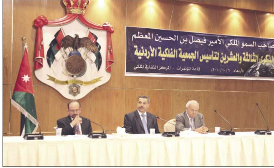
□ خلال الاحتفال

مندوب سمو الأمير فيصل بن الحسين راعي الحفل د. نبيل شواقفة عدداً من المؤسسات الرسمية والأهلية والأفراد الذي ساهموا في دعم نشاطات الجمعية.