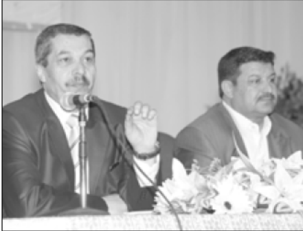
☉ الشوافة ملتقى الطلبة الجدد في آل البيت

للطلبة طيلة مدة دراستهم. مستذكراً العديد من المشاريع التي أقامتها الجامعة خدمة للمجتمع المحلي وللطلاب. وكان عميد شؤون الطلبة الدكتور خليل حجاج قد ألقى كلمة رحب فيها بالطلبة الجدد موضحاً النشاطات التي تقوم بها عمادة شؤون الطلبة لخدمة إبداعات وأنشطة الطلبة. وفي ختام اللقاء الذي حضره نواب الرئيس الدكتور جهاد المجالي والدكتور هاشم المساعد والدكتور ناصر الخوالدة وعمداء الكليات أجاب الدكتور الشوافة على أسئلة واستفسارات الطلبة حول العديد من القضايا الجامعية. ☉